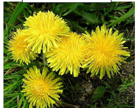
Löwenzahn Taraxacum officinalis