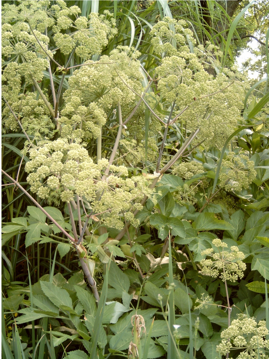
Angelikawurzel – Angelica archangelica