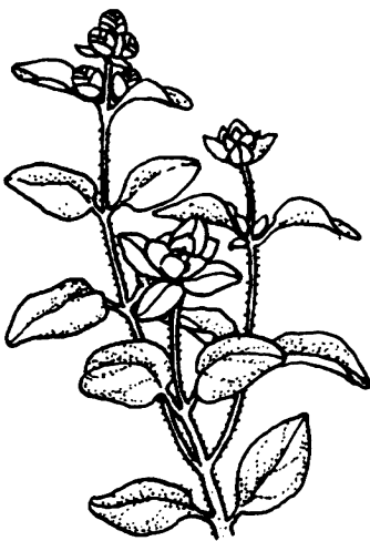
Majoran: Origanum majorana Ganze Pflanze als Gewürz, ätherisches Öl