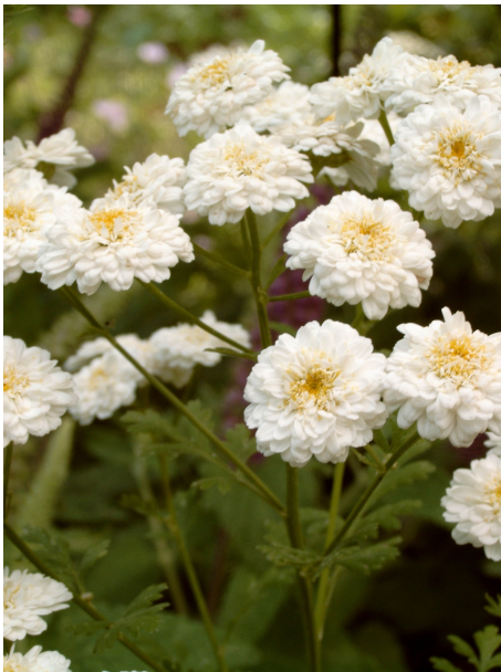
Kamille, römisch: Anthemis nobilis alter Name : Chamamaelum nobile